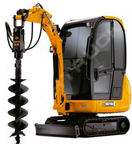
Екскаватор JCB 8016CTS